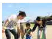
フラフープリレー

爽やかな秋空の下、恒例の運動会を武庫川河川敷で行いました。大人も子どもも、楽しく、気持ちの良い汗を流しました。