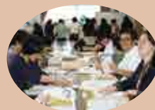
Gloryを配る前には二つ折りにします。