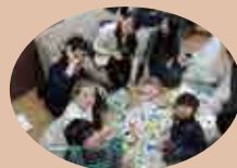
集まったペットボトルのフタを数えています。