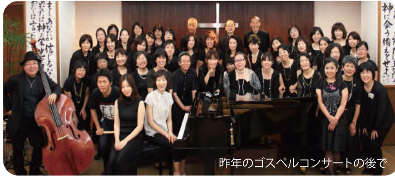
昨年のゴスペルコンサートの後で

Program Shout to the Lord In the Sanctuary I Need You To Survive Oh, Happy Day 愛するきみへ ほか